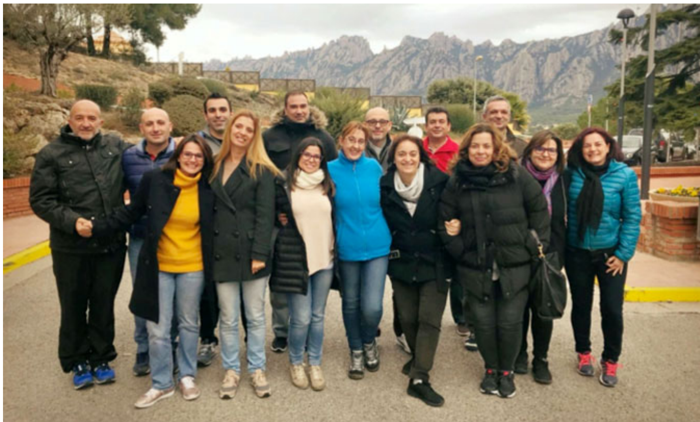
Sexta promoción del 'Programa de desarrollo de jefes de área' impartido por EADA.