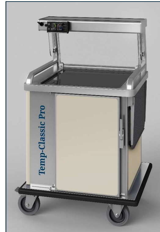
Vitrina de protección