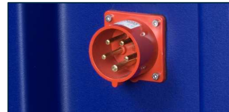
230 V - 400 V Clavija fija