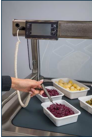
Sonda de temperatura