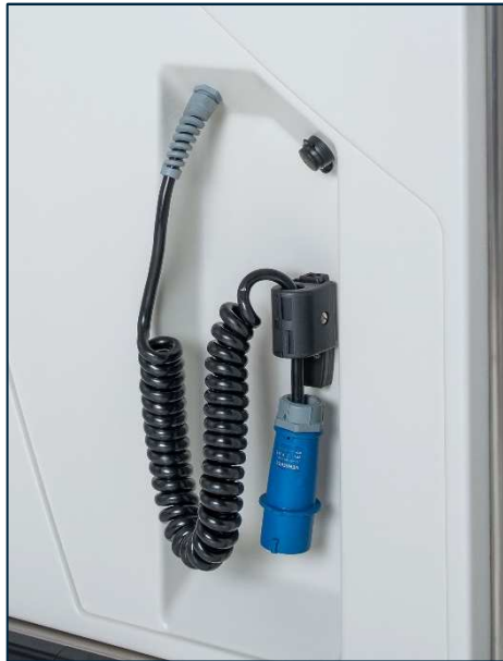
230 V - 400 V Cable + Clavija